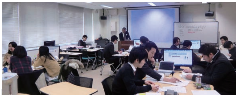
ビジネス ゲームによる体験学習研修風景 (2012. 春)

ケース研修では、小グループによる討議形式で実施します。ここでは、参加者が今までの現場経験と対応行動等の共有認識の場からスタートし、新たな取り組みに向かって自らが「意識を変える」「知識を習得する」「行動を変える」ことを実例の展開から構築していきます。