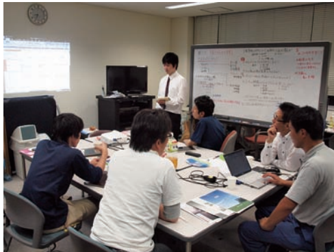
研究室でのシステム構築討議風景 (2012. 夏)

PBL(Project Based Learning)とは、現実世界における問題の解決を図るために行なわれる、参加者による主体的学習を重視した体験型学習のことです。この仕組みを展開します。